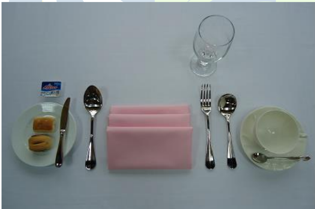
單人份擺設參考圖